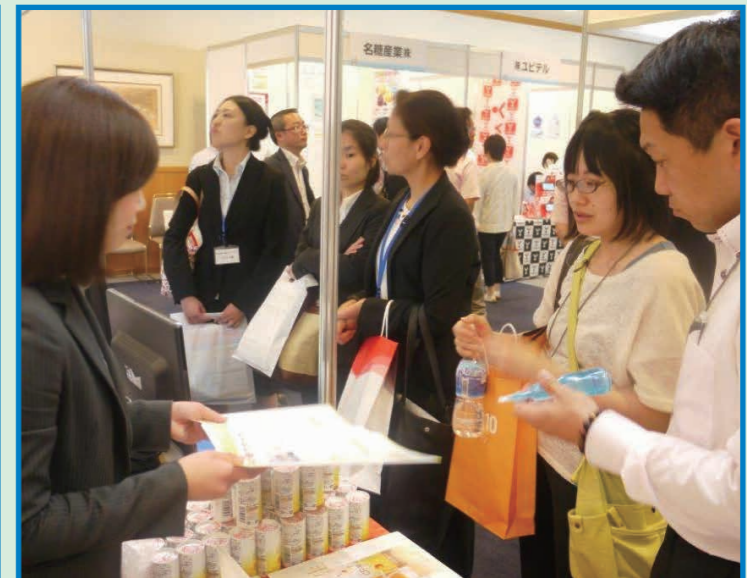
37社協力による企業展