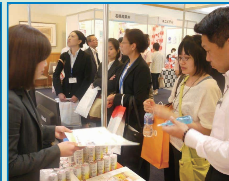
37社協力による企業展